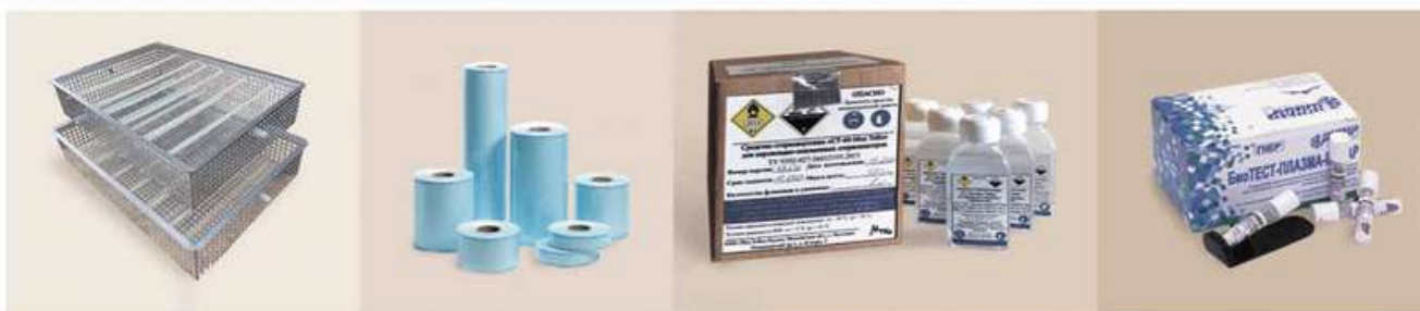
Корзины для инструмента